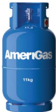
Butla stalowa 11 kg z kołnierzem, bez widocznych uszkodzeń .

Butle bezkołnierzowe pozwalające na założenie kołpaka ochronnego na zawór.