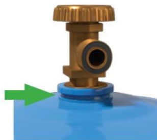
Widoczny rowek na zabezpieczenie kołpaka ochronnego.

Butle bezkołnierzowe pozwalające na założenie kołpaka ochronnego na zawór.