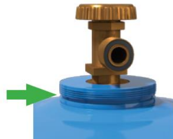
Widoczny szeroki gwint , na który można założyć kołpak .